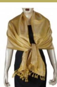
Long foulard en soie...